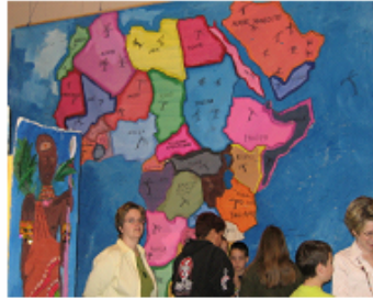
La carte créée par des élèves dans le cadre du projet l'Amérifrique.